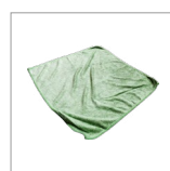
RIP6001 Panno in microfibra 350 GSM 400X400mm