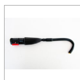
MGK04AN Lancia vapore curva ottone 12cm