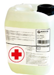
RIP1519 DISINFETTANTE BIOCIDA 5 LT

Prodotto biocida approvato dal Ministero Della Salute.