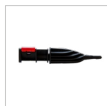
MGK04N Lancia vapore