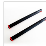
MGK02N (X2) Prolunghe vapore 2 pz