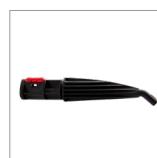
MGK04NC Lancia vapore curva