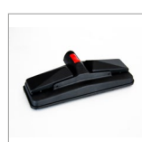
MGK07NV Spazzola rettangolare vap. c/velcro