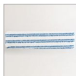
RIP0811/12/13/14 Panno microfibra 400x100 per RIP0801