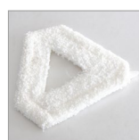
RIP6102 Panno triangolare microfibra velcrato bianco