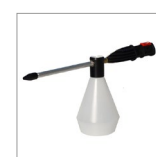
CVK36N Nebulizzatore a vapore