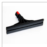
MGK05N Tergivetro vapore