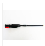
MGK04BN Lancia vapore prolunga ottone 19cm