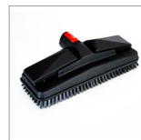
MGK07N Spazzola rettangolare vapore