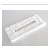
RIP6101 Panno microfibra velcrato 330x150 bianco