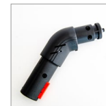
MGK03N Raccordo spazzole vapore