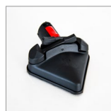
MGK06NV Spazzola triangolare c/velcro vapore