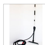
RIP0801 Spazzolone a vapore MOP Tubo 5mt