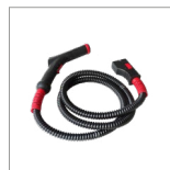
MGK01NW Impugnatura vapore 2 mt