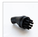
MGLND Spazzolino ø26mm curvo nylon